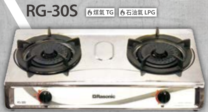
RG-30S 煤氣 TG 石油氣 LPG