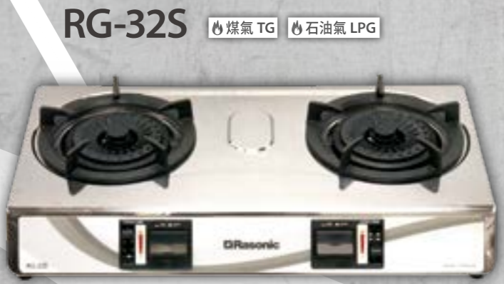
RG-32S 煤氣 TG 石油氣 LPG

樂信牌最新座檯煮食爐 RG-30S 及 RG-32S, 配備「內旋式」火焰及「上進風」高效能爐頭, 燃燒效能卓越, 煮食更快捷!