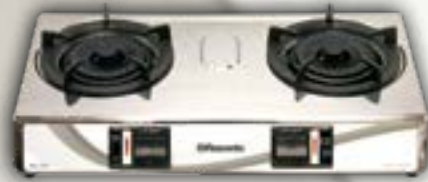
RG-32S「內旋式」火焰·高效能·更環保