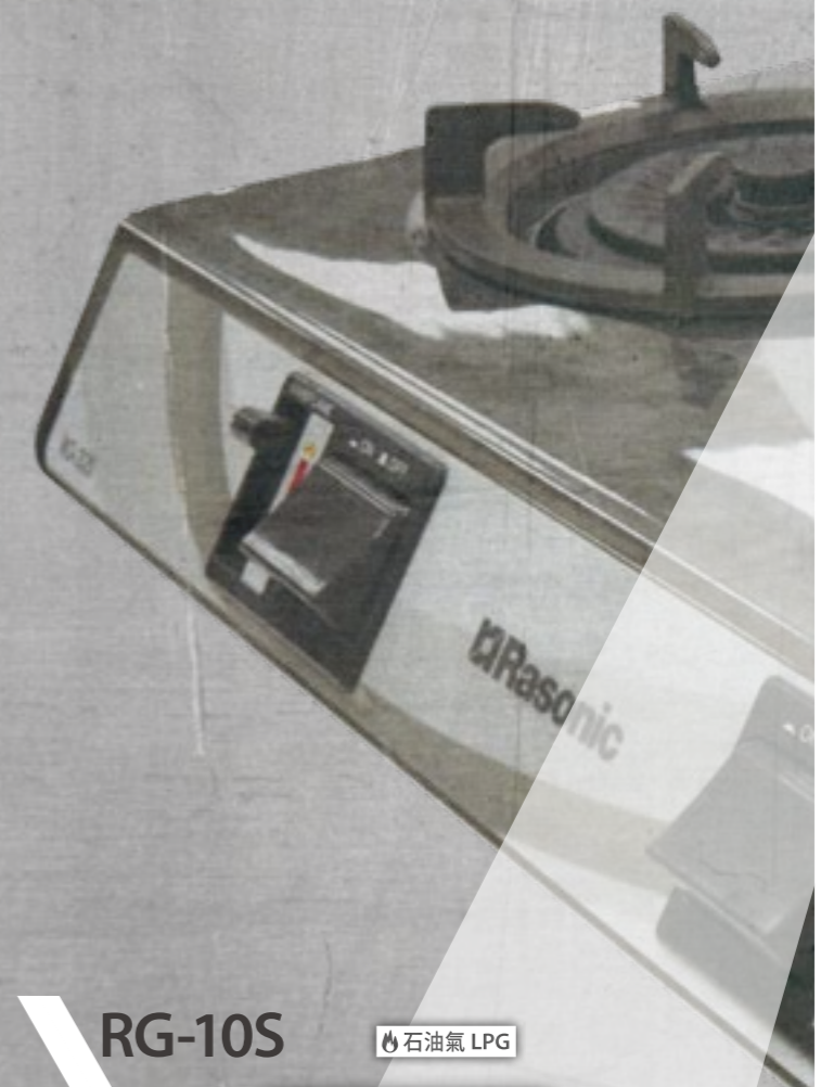
RG-10S 石油氣 LPG